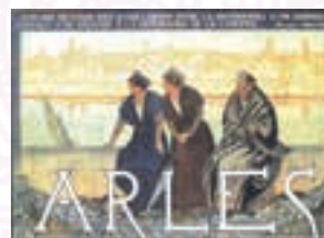
Dessin original créé par Léo LELEE pour le Comité des Fêtes d'Arles

Présidente de Festiv'Arles / Comité des Fêtes